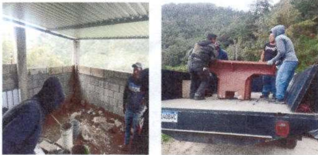
Foto 3: Reparación de piso de torta de concreto y pila de tres lavaderos.