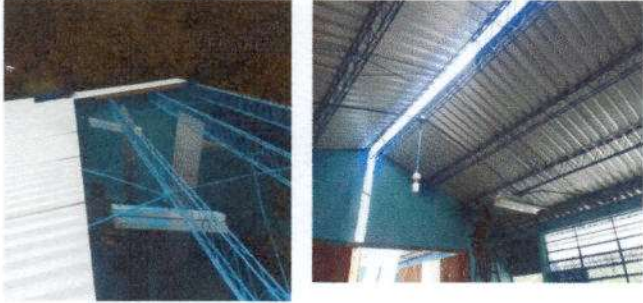
Foto1: Sustitución de lámina, por lámina troquelada de aluzinc calibre 26 módulos 1,2,3,4 y 5