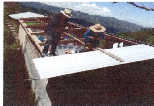
Foto 4: Sustitución de lámina, por lámina troquelada de aluzinc calibre 26 módulo 3.